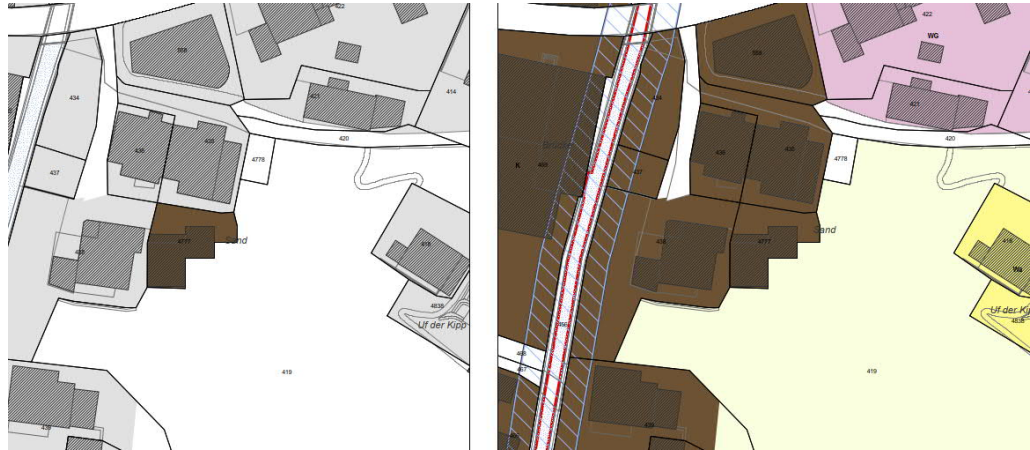
Abb. 3 Ausschnitt Zonenplan (massstabslos)

Im Zonenplan wird die Parzelle Nr. 4777 von der aktuell rechtsgültigen W04 in die angrenzende Kernzone umgezont.