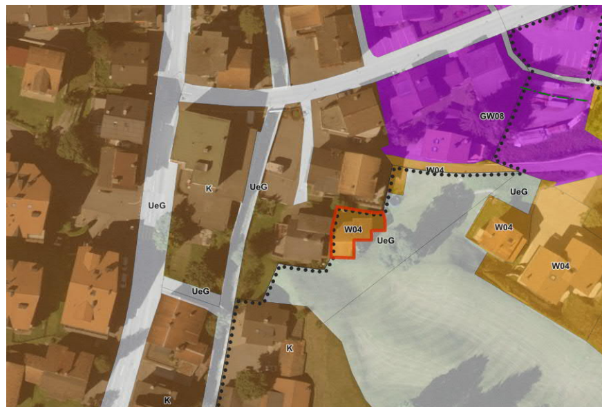
Abb. 2 Übersicht Standort, Ausschnitt Zonenplan, rot bandiert: Parzelle Nr. 4777 (massstabslos, geogr.ch)