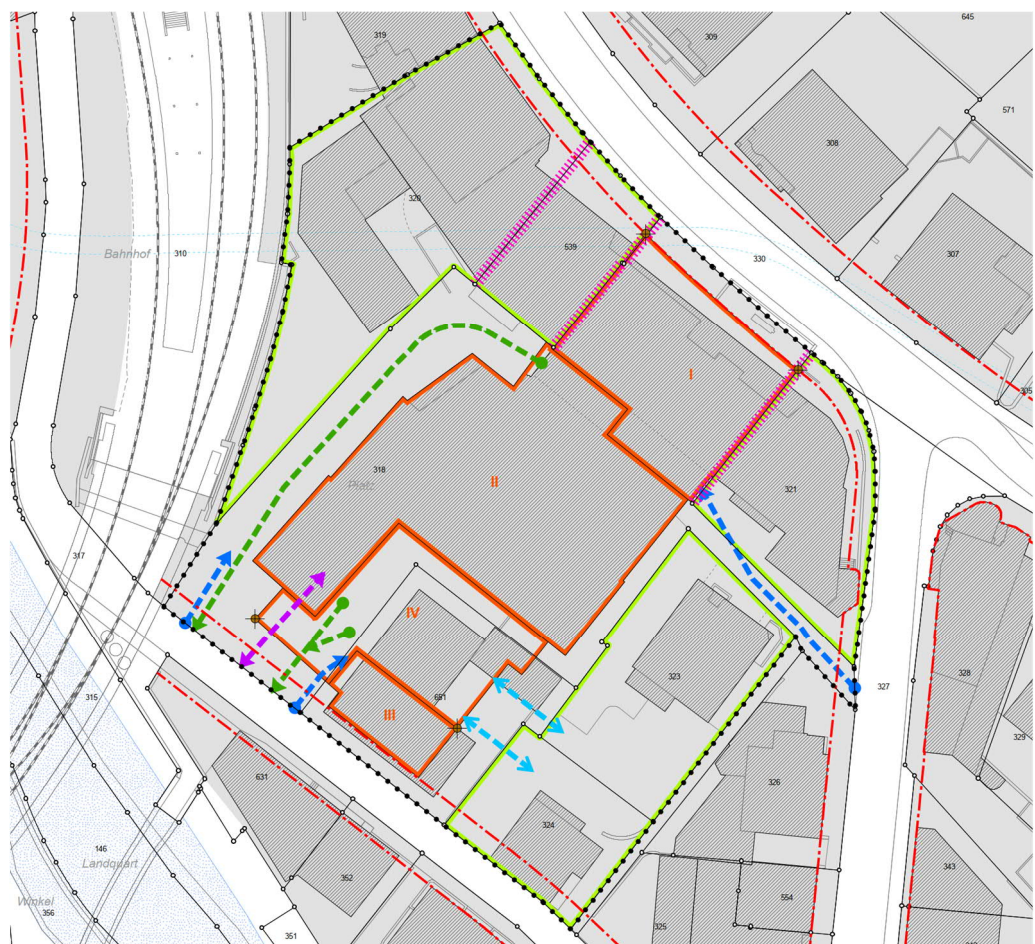
Abb. 5 Übersicht Quartiergestaltungsplan (massstabslos)

Des Weiteren werden im Quartiergestaltungsplan die Standorte der Ein- und Ausfahrten, der Versorgungs- und Abtransportbereiche und die optionalen unterirdischen Verkehrsverbindungen bezeichnet.