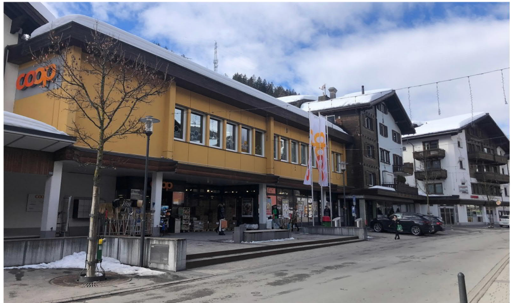
Abb. 1 Foto ins Quartierplangebiet «Coop-Areal», an der Bahnhofstrasse

Des Weiteren müssen die Rahmenbedingungen und Entwicklungsmöglichkeiten planerisch und öffentlich-rechtlich festgesetzt werden, weshalb für das betroffene Gebiet eine Quartierplanung durchgeführt wurde.