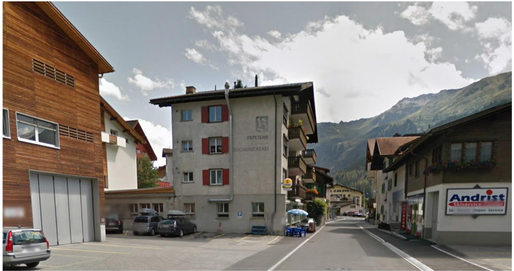
Abb. 3 bestehendes «Haus Brassel» (Streetview)

Zwischen dem geplanten Neubau und dem Gebäude nördlich werden das bestehende Ladengeschoss und das bestehende Parkierungsgeschoss in der bestehenden Struktur Richtung Süden erweitert und mit dem geplanten Gebäude an der «Gotschnastrasse» verknüpft.