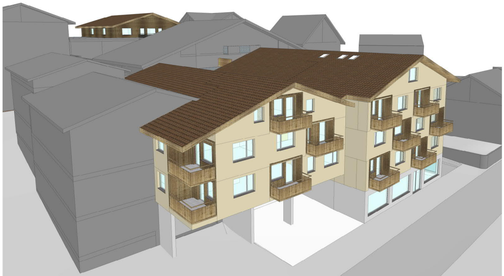
Abb. 4 Schematische Darstellung der geplanten Gebäude

Die Nutzungen im Aussenraum, wie beispielsweise die Zufahrt, die Ausfahrten, die Ver- und Entsorgung bleiben im Grundsatz unverändert. Einige wenige oberirdische Abstellplätze werden aufgehoben und in die geplante Tiefgarage integriert.